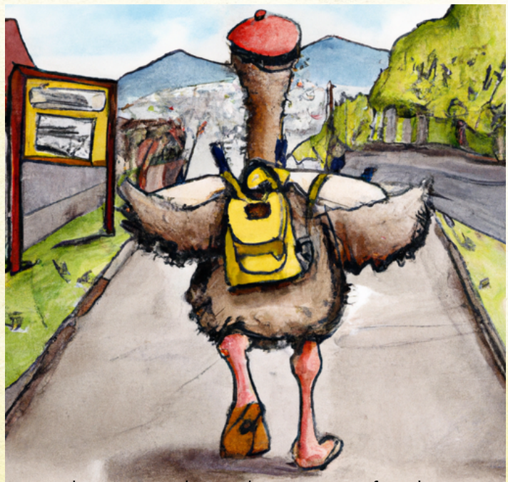
Ilustración de Inteligencia artificial DALL-E.

— ¡Ya nadie me cortará las alas! — dijo y empezó a reír y bailar.